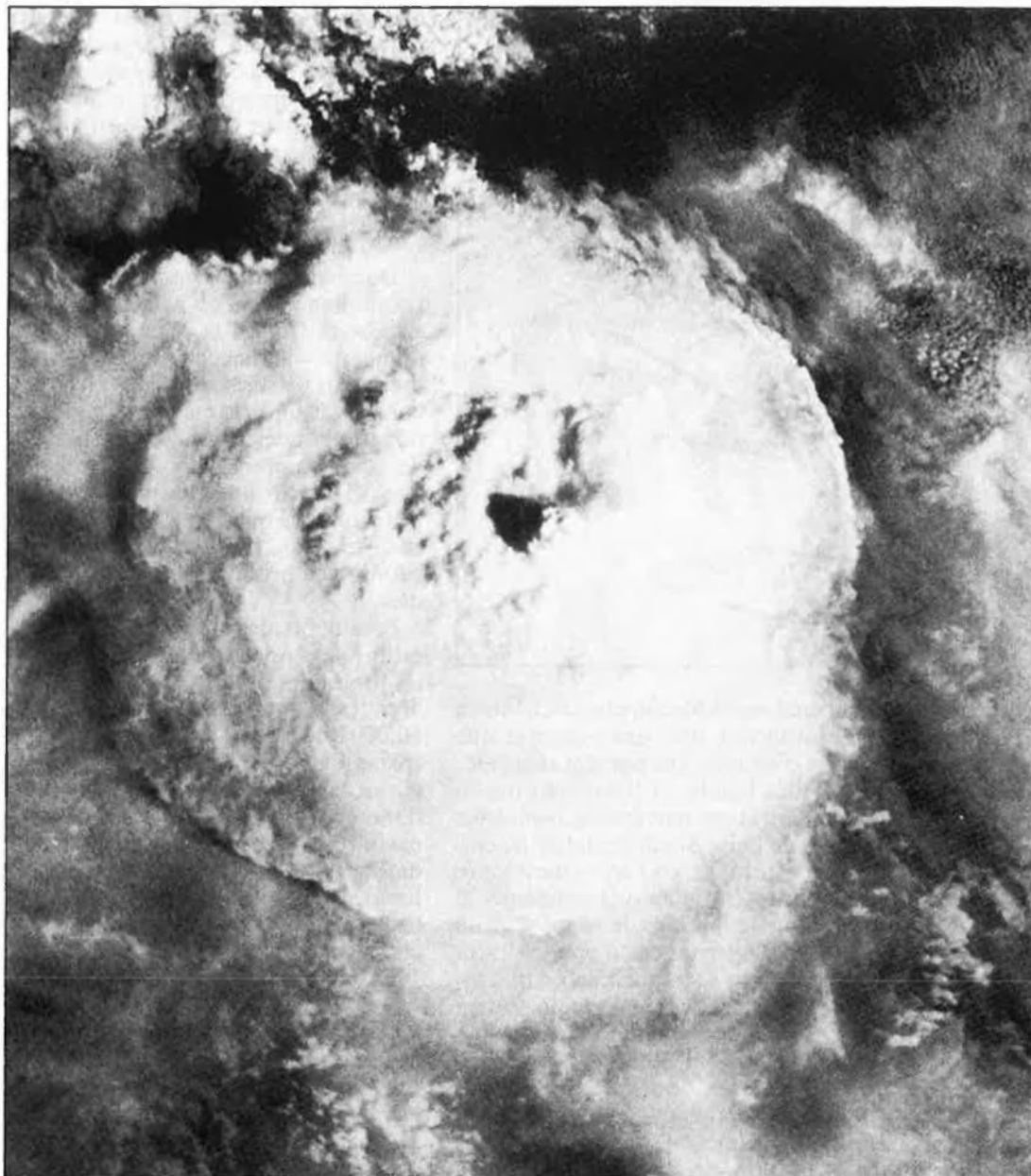
Efectes produïts en els núvols per un huracà.

Les paraules cicló i huracà son sinònims