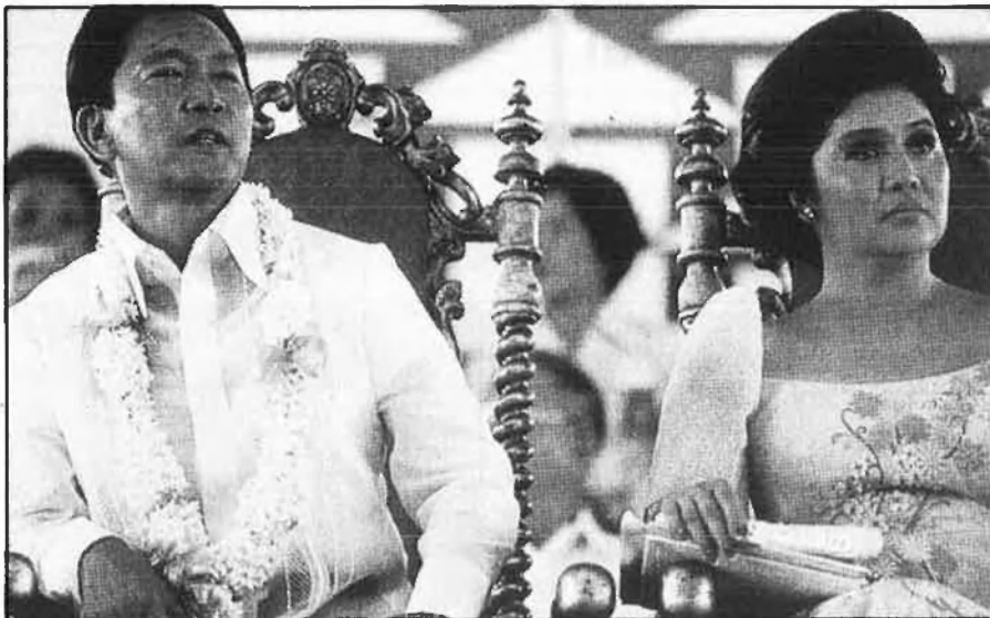
El matrimoni Marcos va desfalcar 103 milions de dòlars del tresor filipí.

Des de feia mesos el govern de la presidenta Corazón Aquino havia posat en marxa una campanya per a recuperar la immensa fortuna que havia arrabassat Ferdinand Marcos al seu país durant els anys d'exercici del poder i que l'havia acompanyat al seu exili de Hawaii. Fonts pròximes a la CIA calculen que només als Estats Units Marcos tenia béns per un valor superior als 3.000 milions de dòlars, més de 450.000 milions de pessetes. Aquesta quantitat no té en consideració els diners que la família Marcos ha anat depositant durant tots aquests anys en comptes corrents d'entitats bancàries suïsses, en diferents holdings financers, companyies situades en diferents paradisos fiscals, obres d'art, tota mena de joies i un edifici de sis pisos al carrer 66 de Manhattan. En una primera aproximació, el govern filipí va valorar els diners que s'havia apropiat Marcos del seu país en una xifra que oscil·lava entre els 5.000 i els 10.000 milions de dòlars.