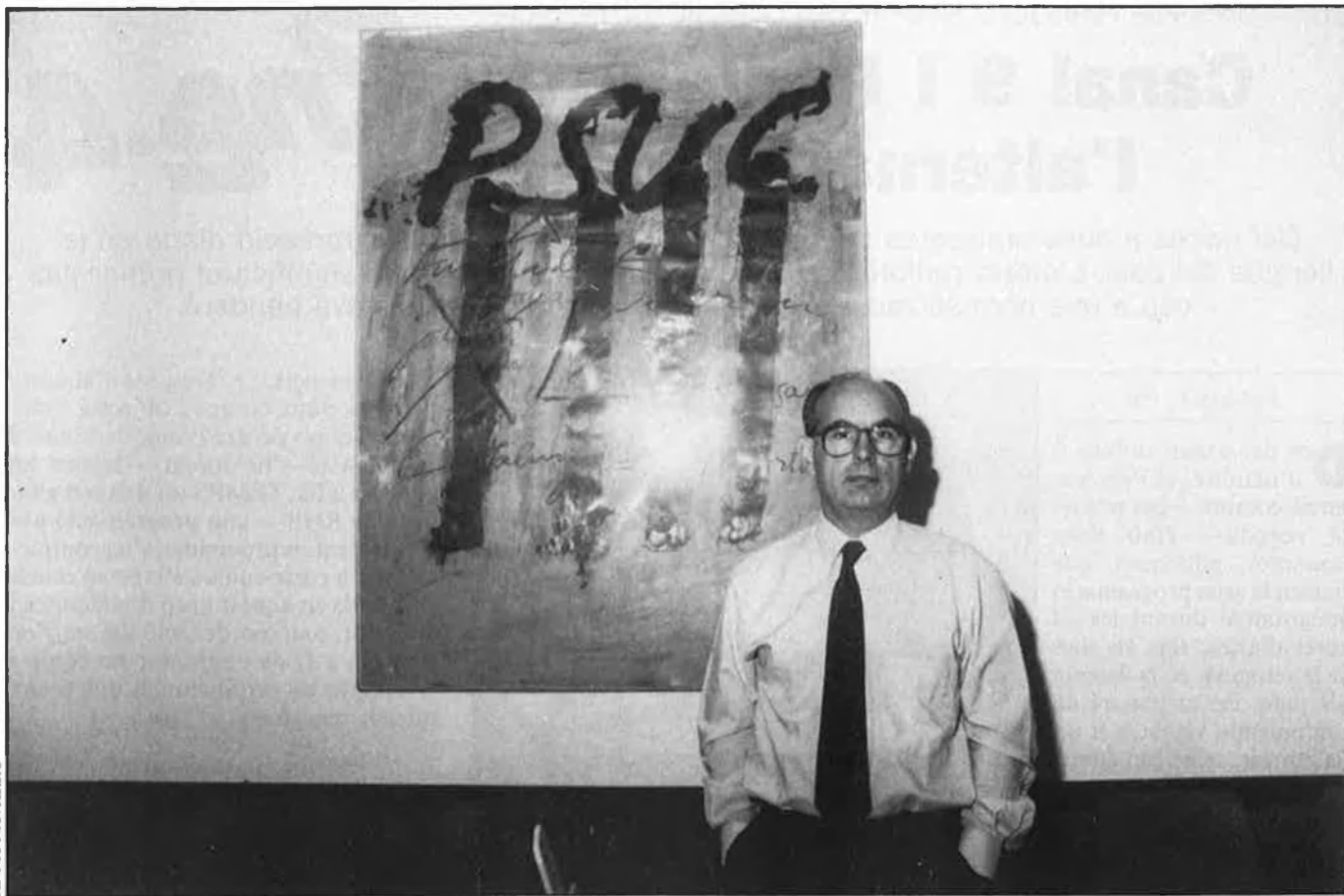
«En IC volem que els directors generals de Televisió no siguin nomenats pel govern».

TV3, siguin elegits pels Parlaments respectius, amb majories qualificades, i que els directors generals dels ens surtin de l'elecció d'aquests consells d'administració, no nomenats pel govern. En definitiva, és el model de la BBC, on regeix un consell cívic nomenat pel Parlament i que després és absolutament independent del govern de torn. I per això tothom alaba la independència de la BBC.