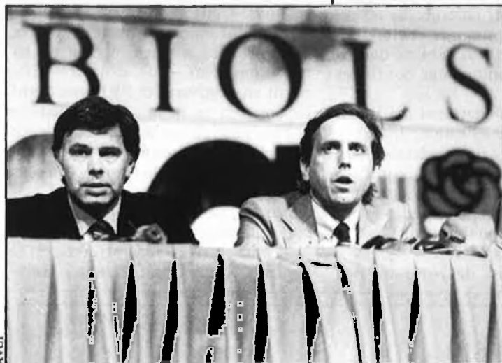
El PSC d'Obiols obrí el foc federal a pesar del govern.

* Professor de Ciència política a la Universitat Autònoma de Barcelona.