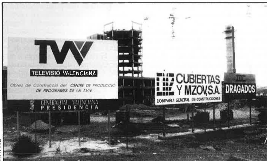
Encara faltava l'arc que tant ha retardat les obres.

Pel gener de 1987 s'adjudicà l'obra civil, la construcció de l'edifici, a la unió temporal d'empreses DYCTEVA, Dragados y Cubiertas-Televisión Valenciana, per un pressupost de 1.389,6 milions i un termini de construcció de 15 mesos. L'oferta era, sens dubte, la millor, perquè representava la unió de dues de les empreses més fortes del sector i una baixa de tres mesos en el temps demanat per la presidència de la Generalitat i de 226 milions respecte al