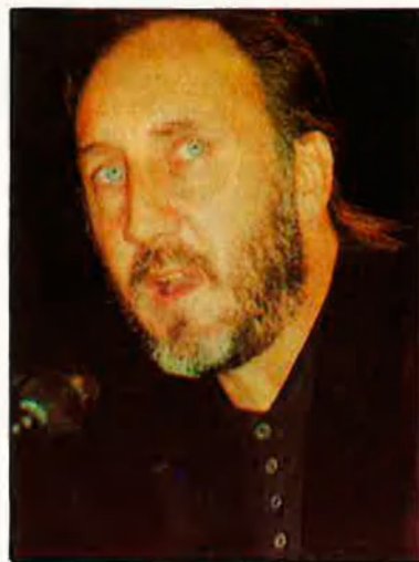
Pete Townshend. 'Who's who'.