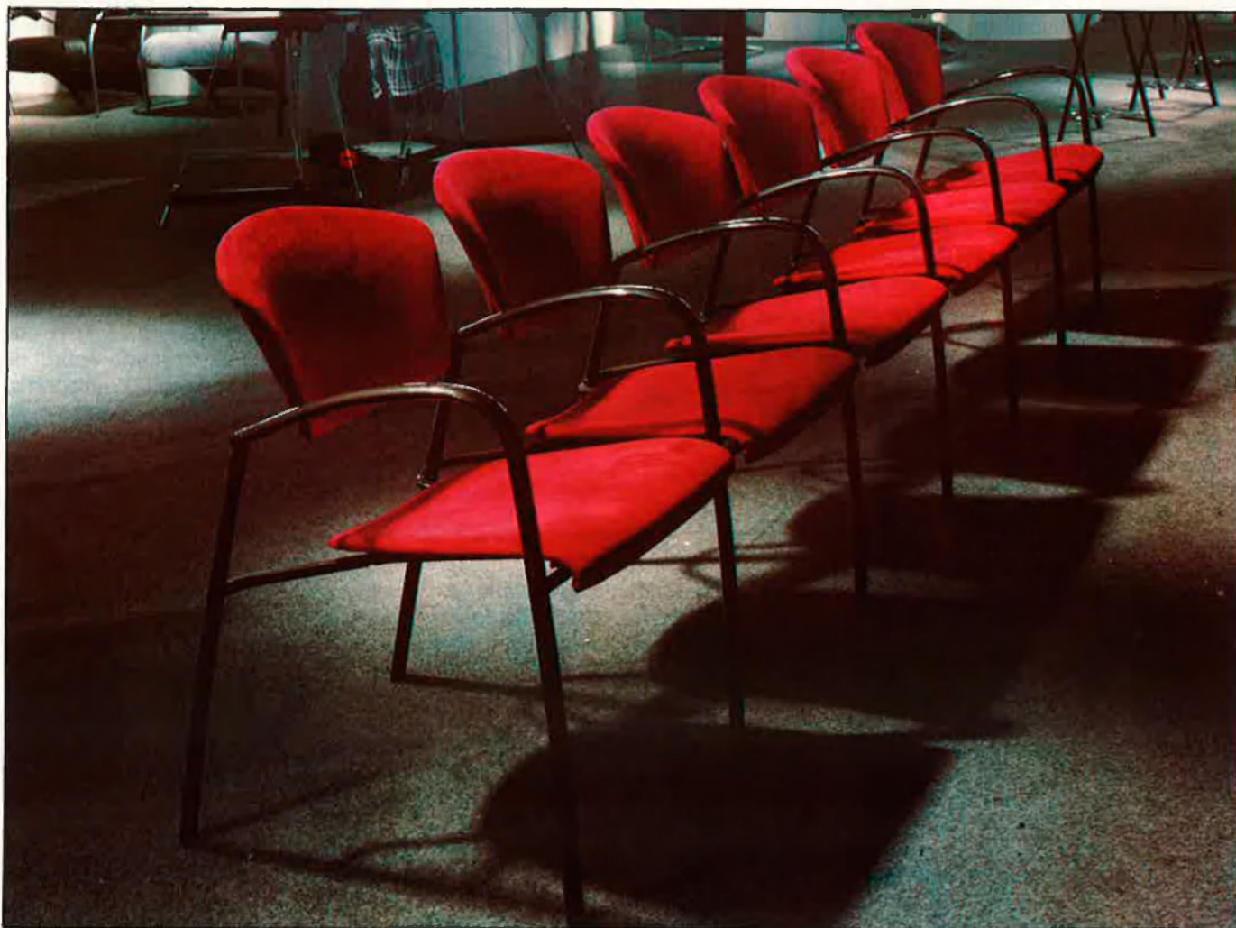
Trencar les tendències clàssiques és un dels reptes dels fabricants valencians.

El nou edifici, que amplia en 14.000 metres quadrats la superfície total, ha estat construït en el temps rècord de 150