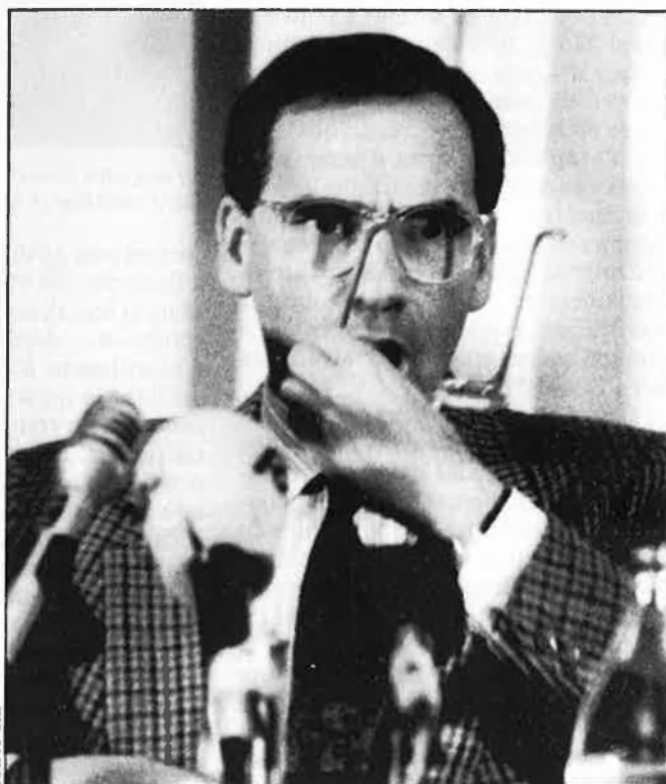
El descontentament contra Felipe González i Alfonso Guerra és com més va més gran.