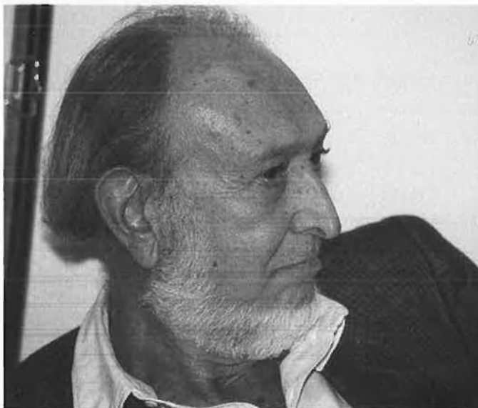
Josep Maria Castellet.

Debatre sobre el món i la vida viscuts, sobre la necessitat de furgar en el passat i escriure'n, ha estat l'objecte del darrer curs de la Universitat Internacional Menéndez Pelayo celebrat a València. Durant una setmana un grup d'escriptors i intel·lectuals han reflexionat sobre «L'art de la memòria».