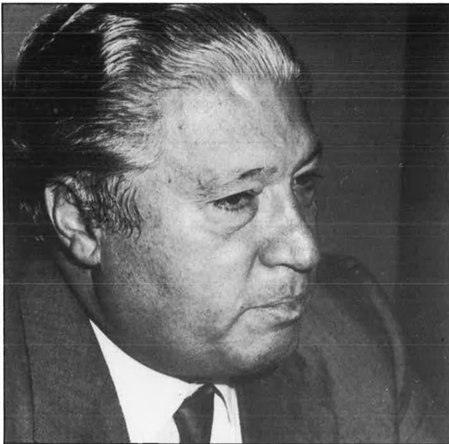
«El govern central ha d'explicar mesures fiscals que fomentin la inversió».