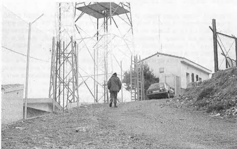
La Guàrdia Civil ha estat durant una setmana apostada davant el repetidor del Bartolo per a procedir al seu tancament.

* Divendres 8, 17.00 a l'aeroport de Manises.