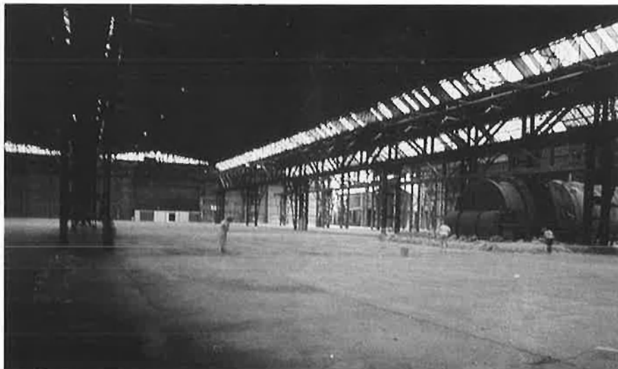
La Farga, un centre pioner en la recuperació d'antics espais industrials.

Els galeristes catalans, els de l'estat espanyol, els europeus i els americans, han copsat la importància de Barcelona com a centre neuràlgic i difusor artístic; i no solament per ser la ciutat des d'on s'han projectat mundialment alguns dels artistes més importants del segle XX. La mateixa fira ARCO de Madrid, que funciona des de l'any 1982 amb el suport del Ministeri de Cultura, ha reconegut que un 80% de les seves vendes van a col·leccionistes o visitants catalans. Aquest, per si mateix, seria un argument de màrqueting prou convincent per a engegar una iniciativa d'aquest tipus. Però, a més, hi ha l'evidència del boom del mercat de l'art, que s'ha manifestat especialment en els darrers cinc anys. I això podria beneficiar tots els circuits comercials artístics. Com a prova, importants museus com el Georges Pompidou o el Museu d'Orsay de París (ciutat que organitza anualment fins a tres fires d'art diferents) reben cada dia més de 15.000 visitants. No obstant això, fa només quatre anys als quioscos es podien trobar només dues revistes especialitzades en art, mentre actualment podem trobar-hi en la majoria una renglera de gairebé 2 metres de publicacions d'arreu del món: Nova York, Londres, París, Alemanya, Itàlia... Alhora, un