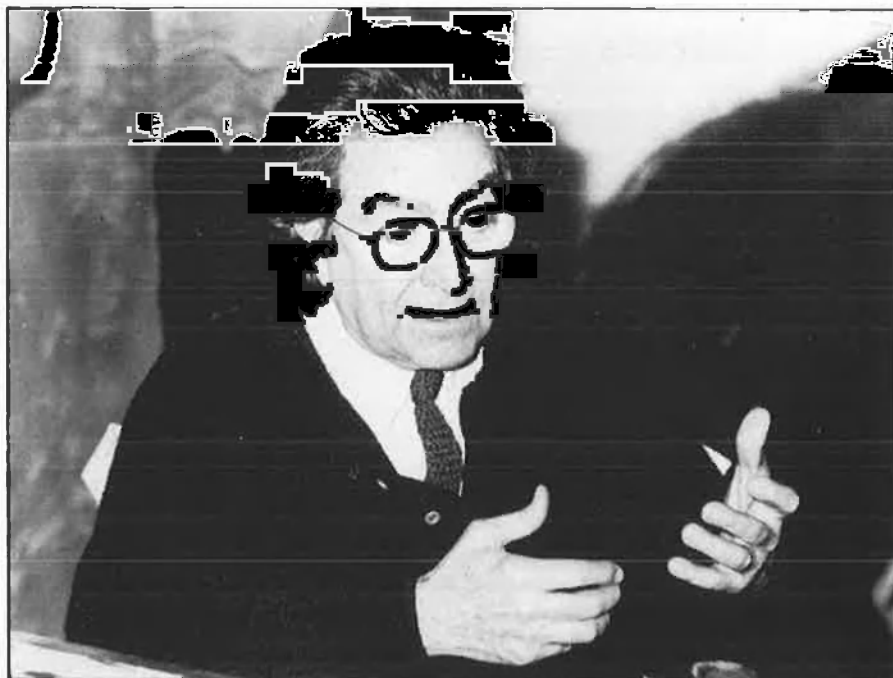
L'obra d'artistes catalans com Tàpies o Miró estarà present en BIAF'89.

sos de l'organització d'ARCO de Madrid, o del mateix Ajuntament de Barcelona.