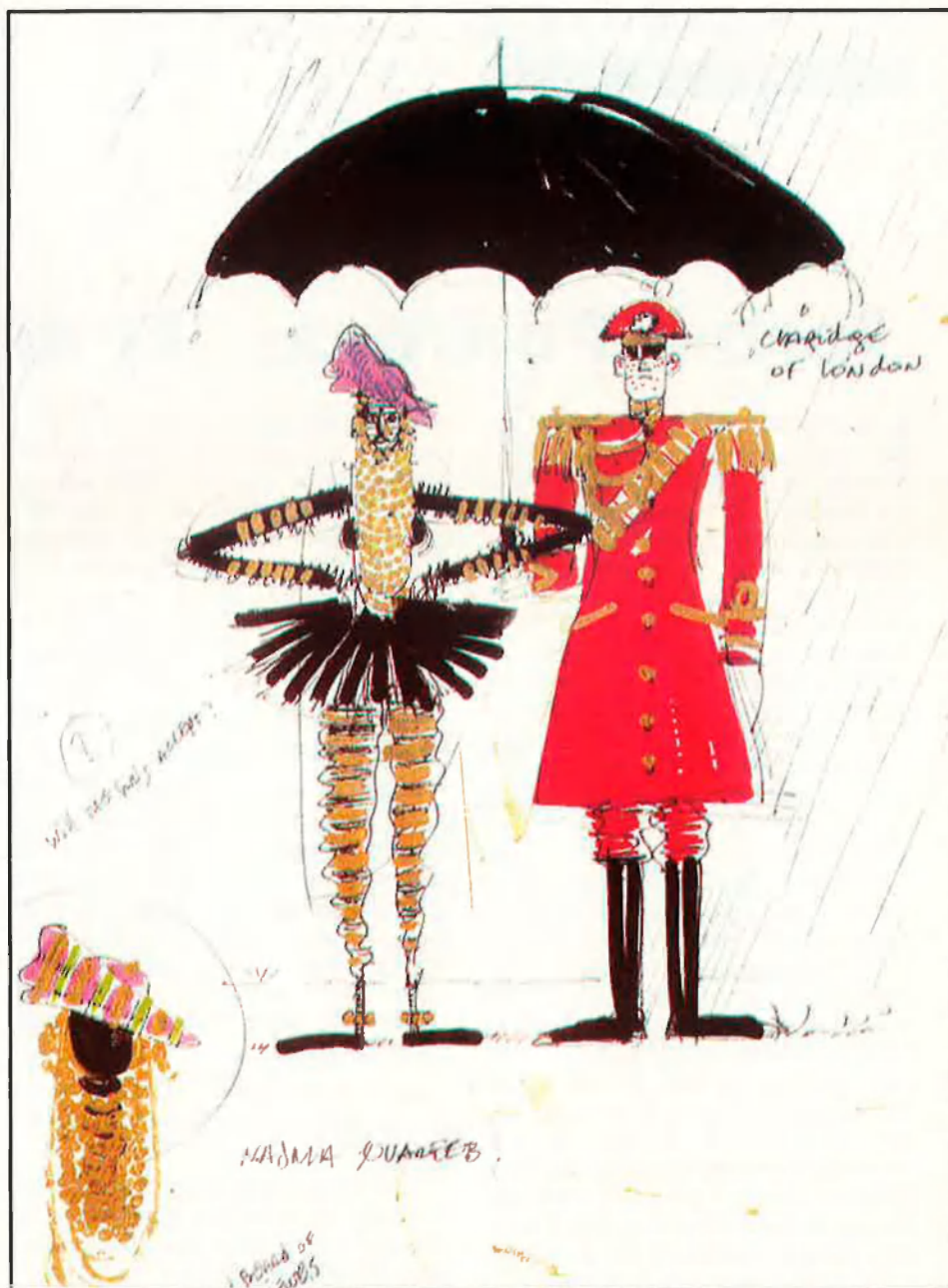
Disseny de Goude per a la festa del Bicentenari.

6.000 participants; 1.000 estrangers i 1.000 soldats de l'armada francesa. 2.500 músics arribats de tot França, 1.500 tambors, 700 cantants de cor, 800 actors, 30 carrosses equipades amb mitjans tècnics, 10 escenaris mòbils, 15 vestits gegants, 1 locomotora de 27 metres, 1 piràmide de tambors africans de 9 metres, 1 tambor xinès de 8 metres, 1 escala mòbil de 15 metres, 1 piràmi-