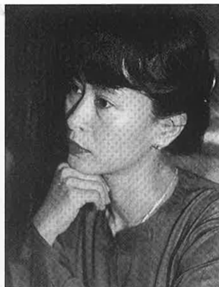
Suu Kyi, líder de l'oposició democràtica.

L'abril de 1988 Suu Kyi va tornar a Birmània per a fer-se càrrec de la seva mare malalta. Els esdeveniments polítics desencadenats al mes de juliol van fer-la aparèixer en l'escena política. Suu Kyi va encapçalar mítings i manifestacions, i amb el vell U Nu —president del govern fins el 1962 quan Ne Win fa donar el colp d'estat que dura fins avui— va reagrupar diverses for-