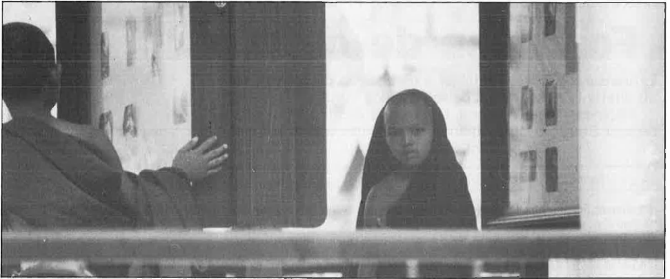
Jove budista a la pagoda Shwedagon, al centre de Rangun.

En els seus mítings ha demanat la dimissió de la junta militar i la constitució d'un govern de transició que convoque eleccions lliures. Davant un milió de persones a la pagoda Shwedagon, al centre de Rangun, va emocionar-se, però va continuar parlant. El mes de juny d'aquest any els tancs van interrompre un dels seus mítings a la capital birmana. Suu Kyi, a la manera de Ghandi, va demanar als soldats que no intervinguessin. Per tot el país es va llançar una campanya de desprestigi contra ella dient que no coneixia Birmània ni la política, que tenia més d'un marit i que vestia a la manera occidental. Els seus referents més propers, tot i que a ella no li agrada comparar-se amb ningú, són altres dues dones: Cory Aquino a Filipines i Benazir Bhutto a Pakistan. Però la societat birmana és diferent, ni la pressió internacional que va derrocar Marcos i va controlar les eleccions pakistaneses, se'n recorda d'aquell país.