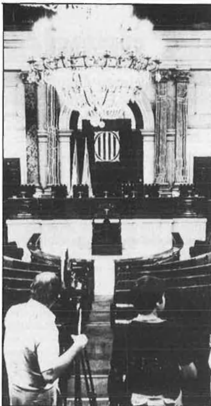
Un dels projectes a Llei que es debatrà al Parlament català serà el de la policia de l'espectacle.

Un projecte important encara no vist per tota la corporació parlamentària és el referent a la Llei d'iniciativa popular. Una proposició de llei que també