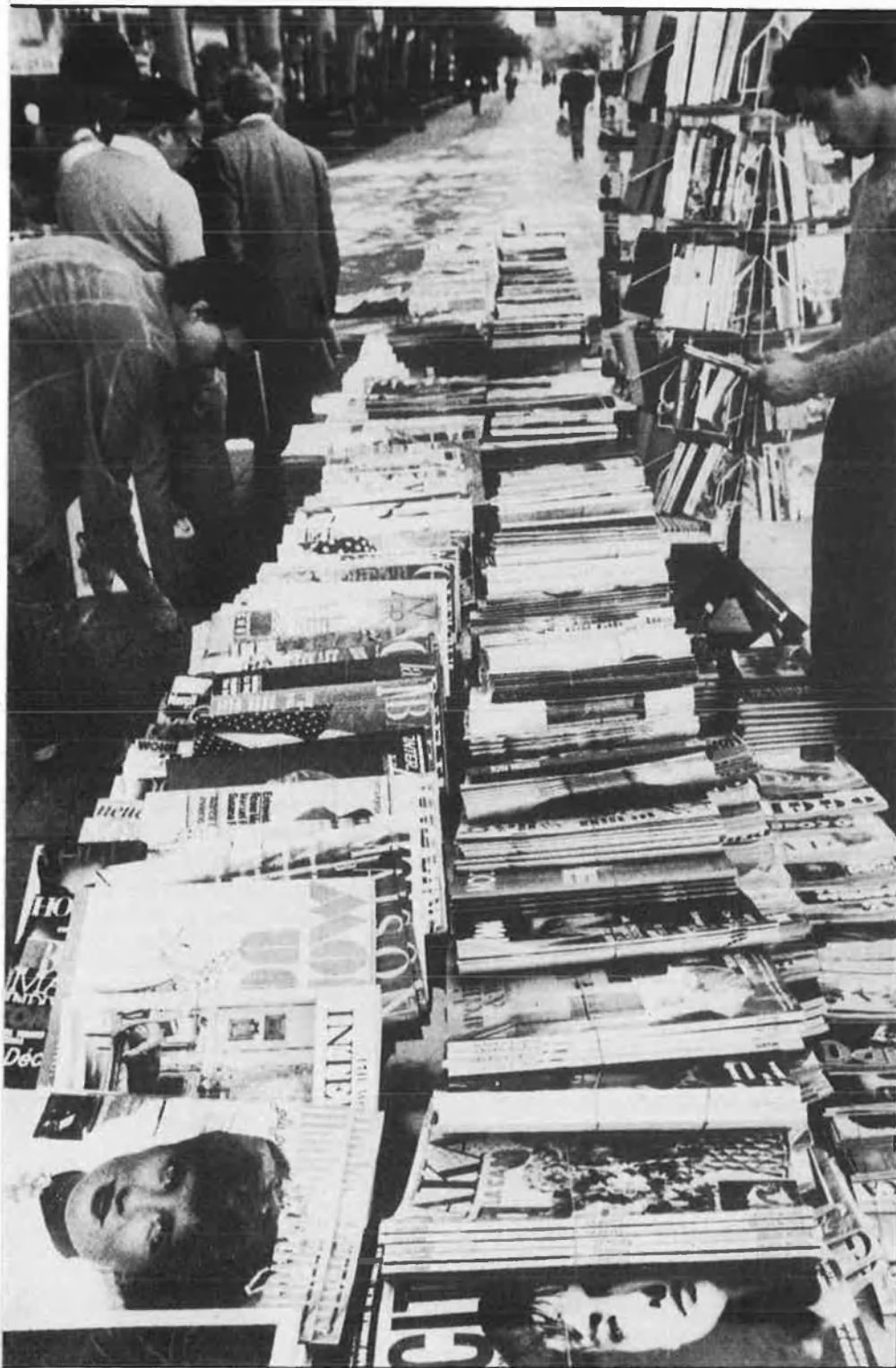
Les revistes de contactes es venen en quioscos, sovint amagades entre les pàgines de revistes més serioses.

R evistes, locals i gabinets constitueixen el rostre públic d'una altra manera de practicar la sexualitat, de l'hedonisme d'un grup social que qüestiona les restriccions de la moralitat general respecte al sexe. Amb una actitud desinhibida que s'expressa en cercles reduïts, perquè la privacitat és encara avui l'única garantia contra la intolerància o els abusos, es reconeixen amb el qualificatiu de liberals.