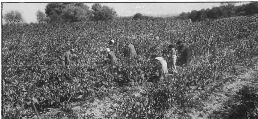
Cada any són més els veremadors provinents d'aquesta banda dels Pirineus.