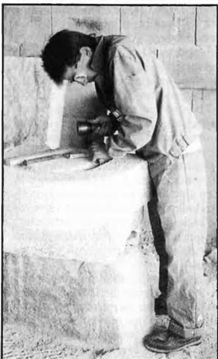
Joves per a recuperar el patrimoni.

46.680 pessetes. A causa dels diferents criteris de programació, les relacions laborals interrompudes són molt freqüents, com també els retards a cobrar els primers quatre mesos de formació que subvenciona l'INEM.