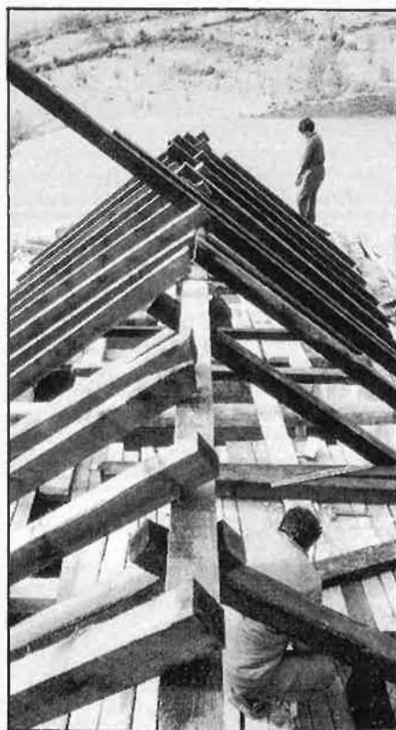
Objectiu: qualificar els joves.

Més d'un any després d'iniciada aquesta experiència al País Valencià, la fórmula es mostra irregular i ineficaç. Sobretot si tenim en compte la quantitat de recursos de què es disposa. Mentre uns gaudeixen de personal qualificat per a l'ensenyament i els ta-