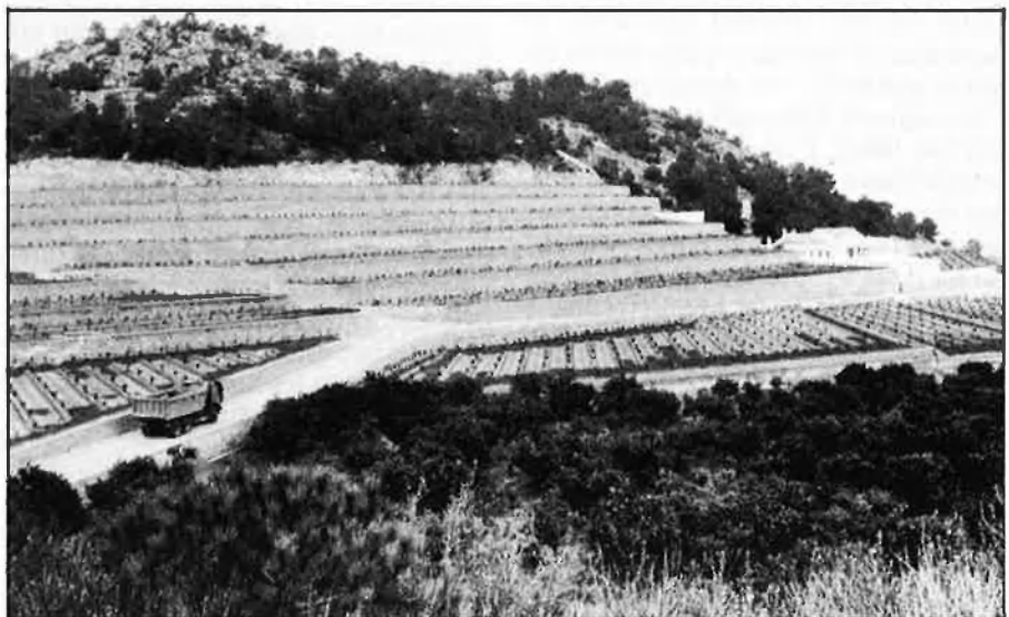
Una disminució dels cabals d'aigua actuals provocaria una severa catstrofe.

Una decisió política —atorgar aigües a Castella-la Manxa— com la que ha pres el govern central ha fet esclatar el conflicte. Diversos estudis realitzats a proposta del govern manxec indiquen que, amb la mecanització, el reg i l'extensió adequada, el conreu de la dacsa o blat de moro, és més rendible que la taronja. No obstant això, tant l'administració autonòmica, com membres dels sindicats agraris valencians al·leguen que tot i que en algun any la comparació entre el preu en origen de la dacsa i de la taronja pugua ser favorable a la primera, la recollida, transport, manipulació en els magatzems i la comercialització dels cítrics valencians generen molta més riquesa i llocs de tre-