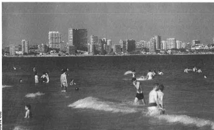
Un projecte per a humanitzar la ciutat.

un equip de professionals encapçalat per l'arquitecte Miquel Fisac. En la presentació del projecte, Fisac deia: «El que intentem és corregir les deficiències que ha ocasionat la deshumanització de la ciutat. La principal característica del nostre projecte és el canvi en la jerarquia de valors. Crearem una ciutat per a viure i conviure.