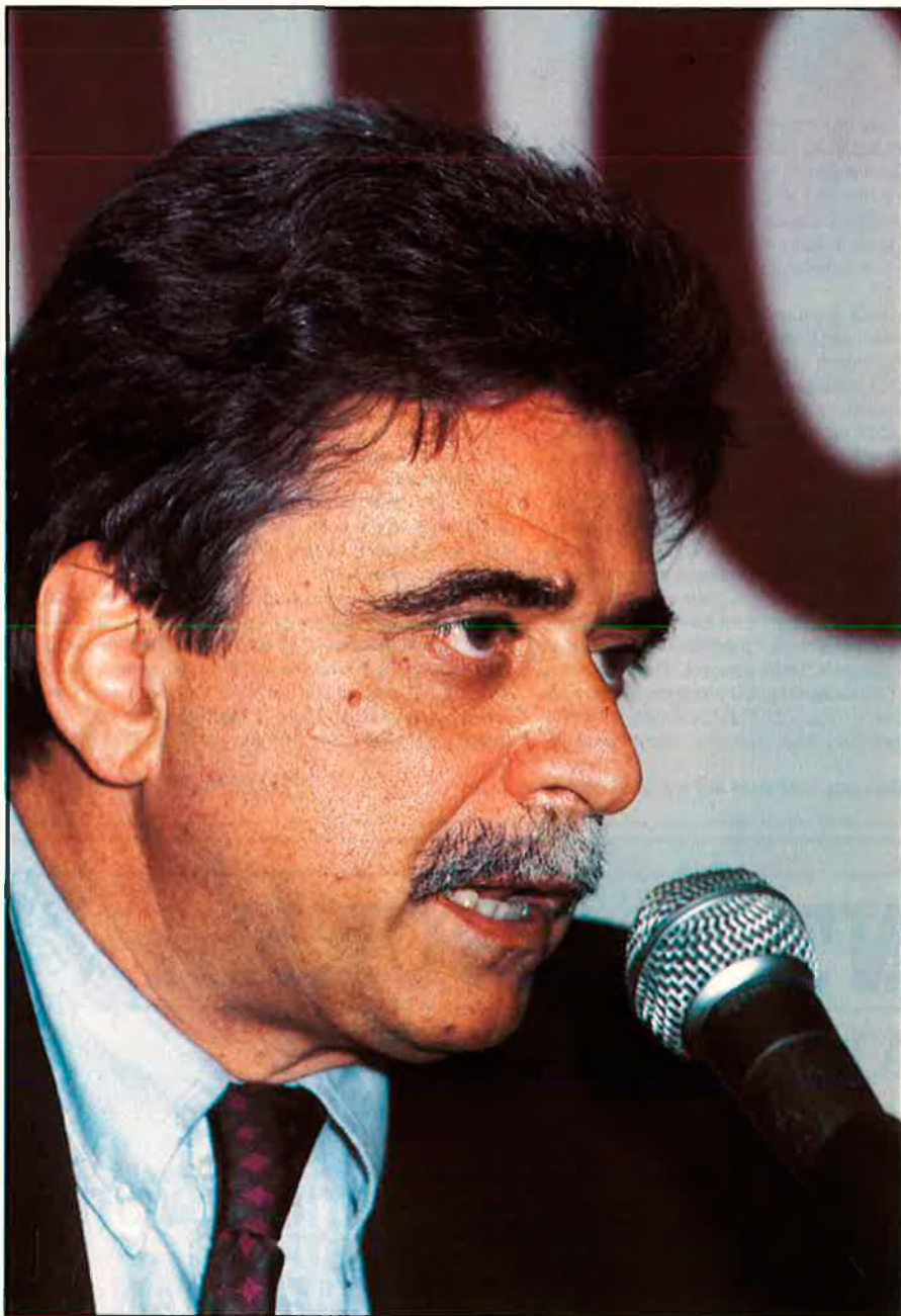
ENTREVISTA A ACHILLE OCCHETTO, LÍDER DELS COMUNISTES ITALIANS