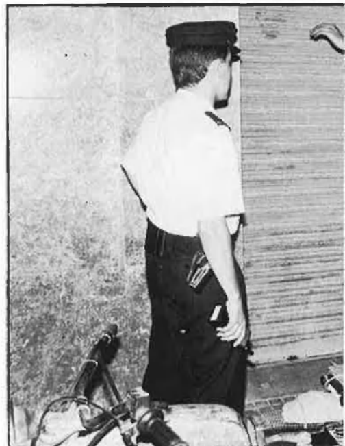
«Bona nit. Documentació, per favor». «No en tinc»

barri xino de Palma. Un captaire amb ulleres de muntura metàl·lica, samarreta de color butà i meyba aprofita els cotxes que s'aturen al semàfor per a demanar alguna cosa als conductors. Hi ha algunes prostitutes que fan el carrer al costat dels veïns que prenen la freca i fan tertúlia als portals de les cases. No es veuen gaires clients.