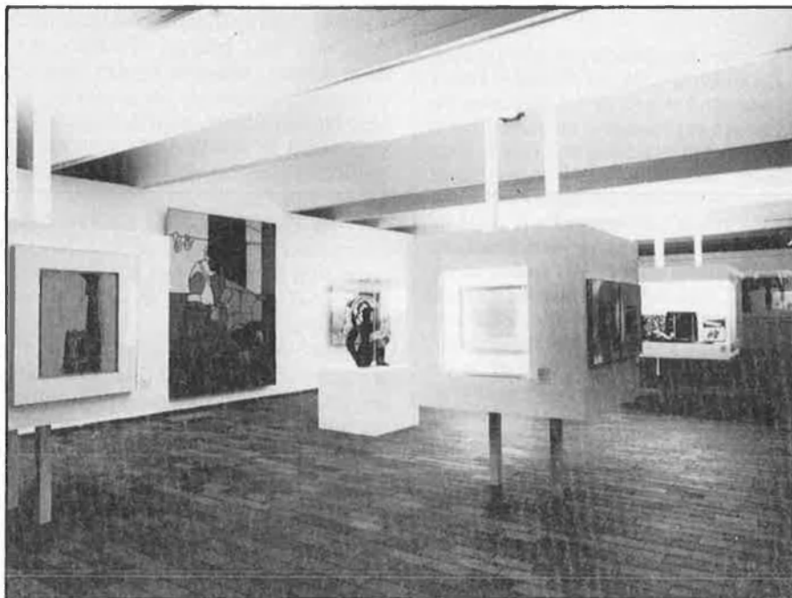
Un 70 per cent de l'obra subhastada de Miró va anar cap a l'estranger.

ara no ha estat la de confiar en les pròpies institucions. Ell mateix ha depositat el seu patrimoni en una fundació pròpia. □