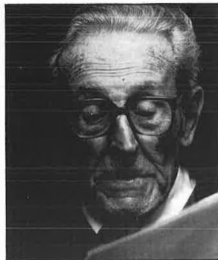
Segons Noguera, només en el cas de Picasso s'ha fet el que ell ha volgut.

Segons aquesta llei, sotmesa al Dret Civil (i Catalunya en Dret Civil conserva la condició de legislar) no hi ha llei estatal que hi pugui interferir. El notari Noguera creu en aquesta llei com a alternativa única de preservar la voluntat del fundador, una voluntat que ell pensa que fins