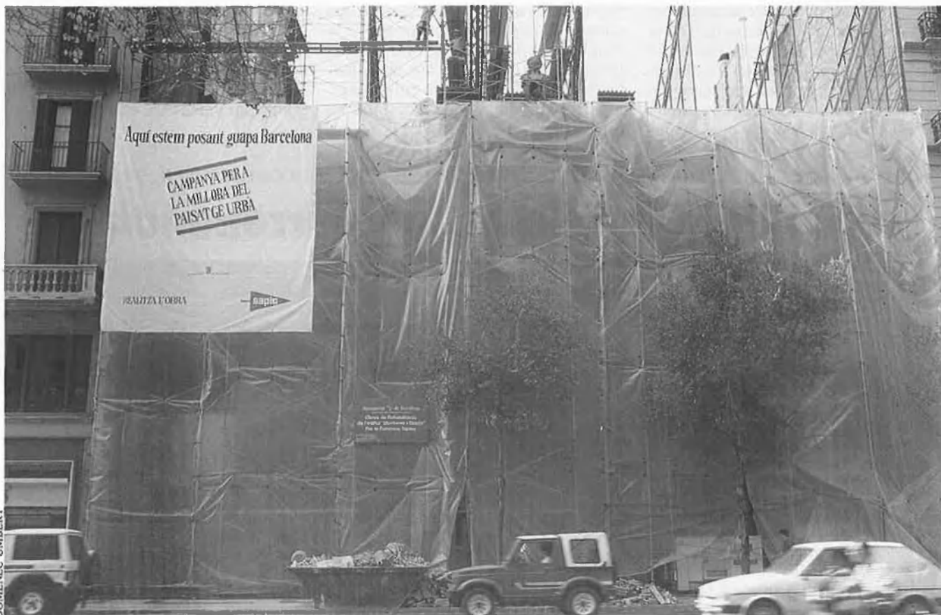
Obres de rehabilitació de l'edifici Montaner i Simón per la Fundació Tàpies.

ha explicat a EL TEMPS que la Fundació no rep cap ajuda institucional. Que el dret d'ús de l'edifici del Teatre-Museu i de la Torre Galatea es tradueix, segons disposicions de Dalí, en una compensació econòmica del museu a l'Ajuntament de Figueres de 10 pessetes per entrada, quantitat que, per la seva banda, destina l'Ajuntament de Figueres al Museu de l'Empordà (on artistes empordanesos fan donacions privades).