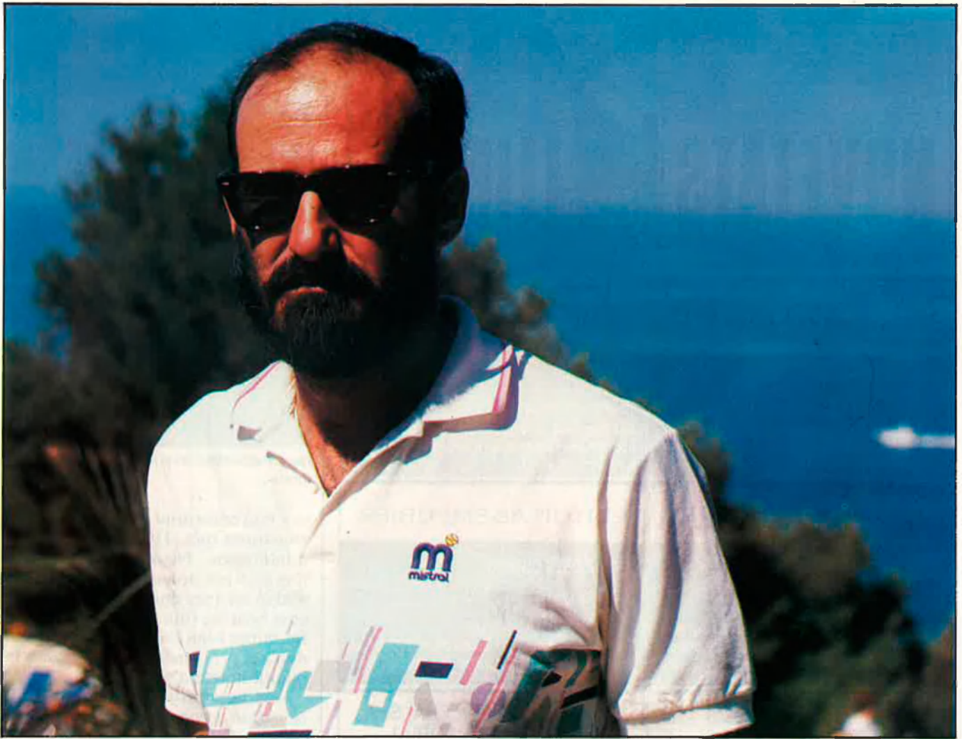
«Les autoritats han estat vençudes per la velocitat del turisme».

món turístic va sempre a remolc dels esdeveniments. I en realitat hauriem de tenir prou capacitat per a decidir el que volem, quin tipus de turista volem, quin tipus d'establiment, i com aconseguir-ho. I això, aquestes definicions, hauria de ser l'objectiu de la política turística, per a veure quin tipus de turisme volem a la comunitat, i no només els hotelers, sinó tots, tota la comunitat de Balears.