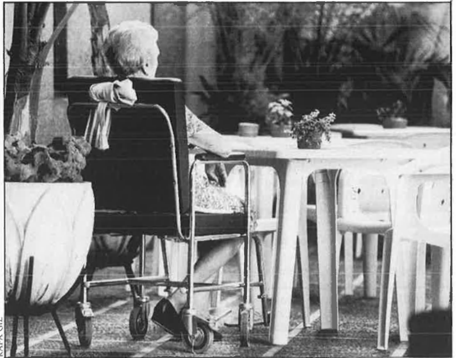
Residències privades: més a prop del negoci que del servei social.

RESIDÈNCIES PER A VELL: SENSE LES CONDICIONS MÍNIMES