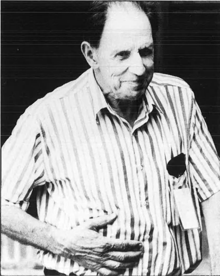
«De jove arreplegava mosques. Aquest és un món meravellós».

pluja rep un mar, més difícil li resulta destruir les deixalles, tots els detritus que arrossega el riu. I això és el que ha passat a l'Adriàtic, on s'han produït un gran nombre d'algues microscòpiques que es nodreixen d'aquestes substàncies. No obstant, això no podria ocórrer mai en les nostres costes, a causa del caràcter obert d'aquestes i al fet que reben, en general, poca aigua de pluja.