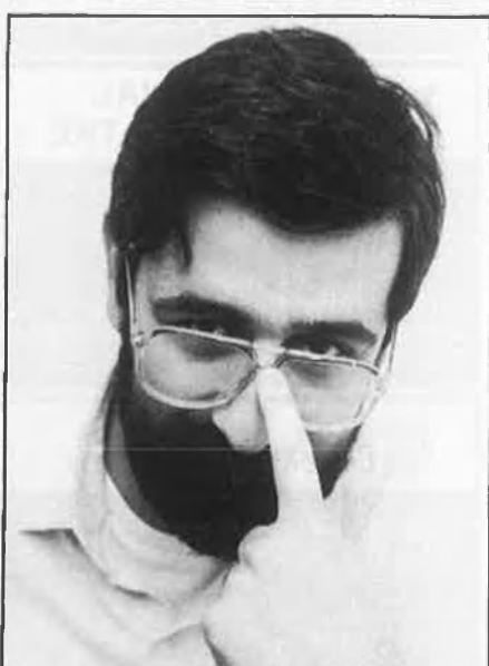
D'esquerra a dreta i de dalt a baix: Joan Barril, Josep Piera, Ramoneda, Nadal Batle, Baltasar Porcel, Pere Verdaguer, Rafael Vallbona, Josep Guia i Vicenç Villatoro.