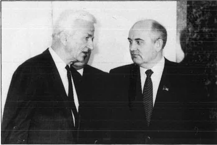
«No volem convertir-nos en l'instrument d'una Unió Soviètica reformada».

s'hi produeix, no hi ha estalvi i, per tant, s'hi viu de crèdits externs. Fa cinc anys, alguns analistes deien que això no podia continuar així sense provocar problemes greus. Però, fins ara, no ha passat res massa seriós.