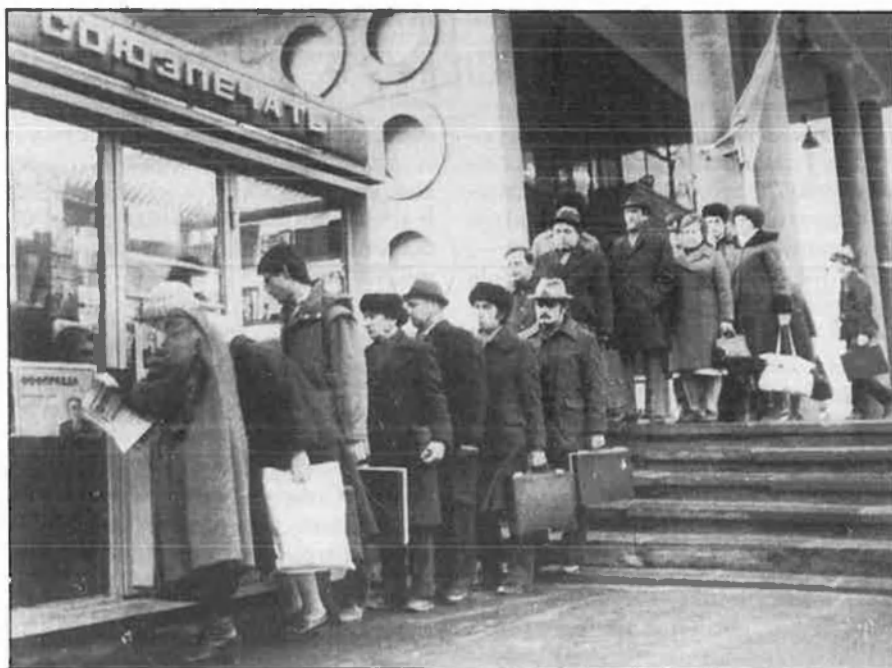
«Quan tot un país esdevé una llarga cua d'espera, arriba un moment que és ell qui decideix».