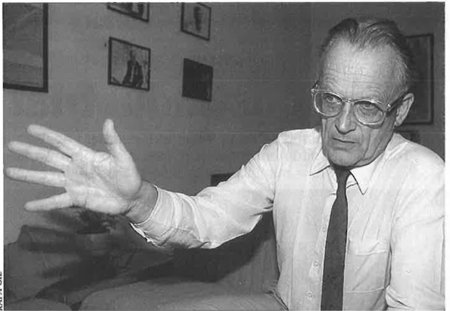
«Sóc antinaturalista, antihistoricista i antifuncionalista».

—Totalment. Era el període macarthista. Aquests intel·lectuals, òbviament, no ho eren. Gent decent. Però eren liberals sense collons. Gent que no lluitava. Estaven en la seua torre de vori i no tenien coratge. Em disgustava l'americanisme després de la victòria, la Pax Americana . Als sis mesos me'n vaig anar a Chicago, una ciutat molt honesta. No hi ha màscares. Em vaig ocupar, sobre el terreny, dels problemes que m'interessaven: la pobresa, el racisme, la desorganització urbana. La meua ment treballava.