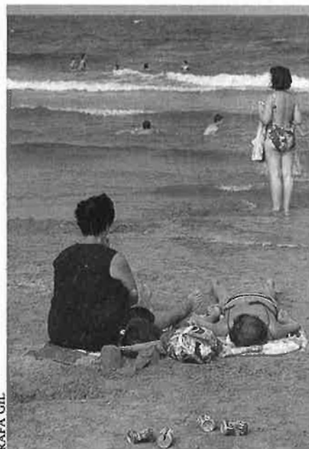
A València, els guardons no es corresponen amb la realitat.