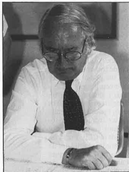
Richard Meier, arquitecte del Museu.