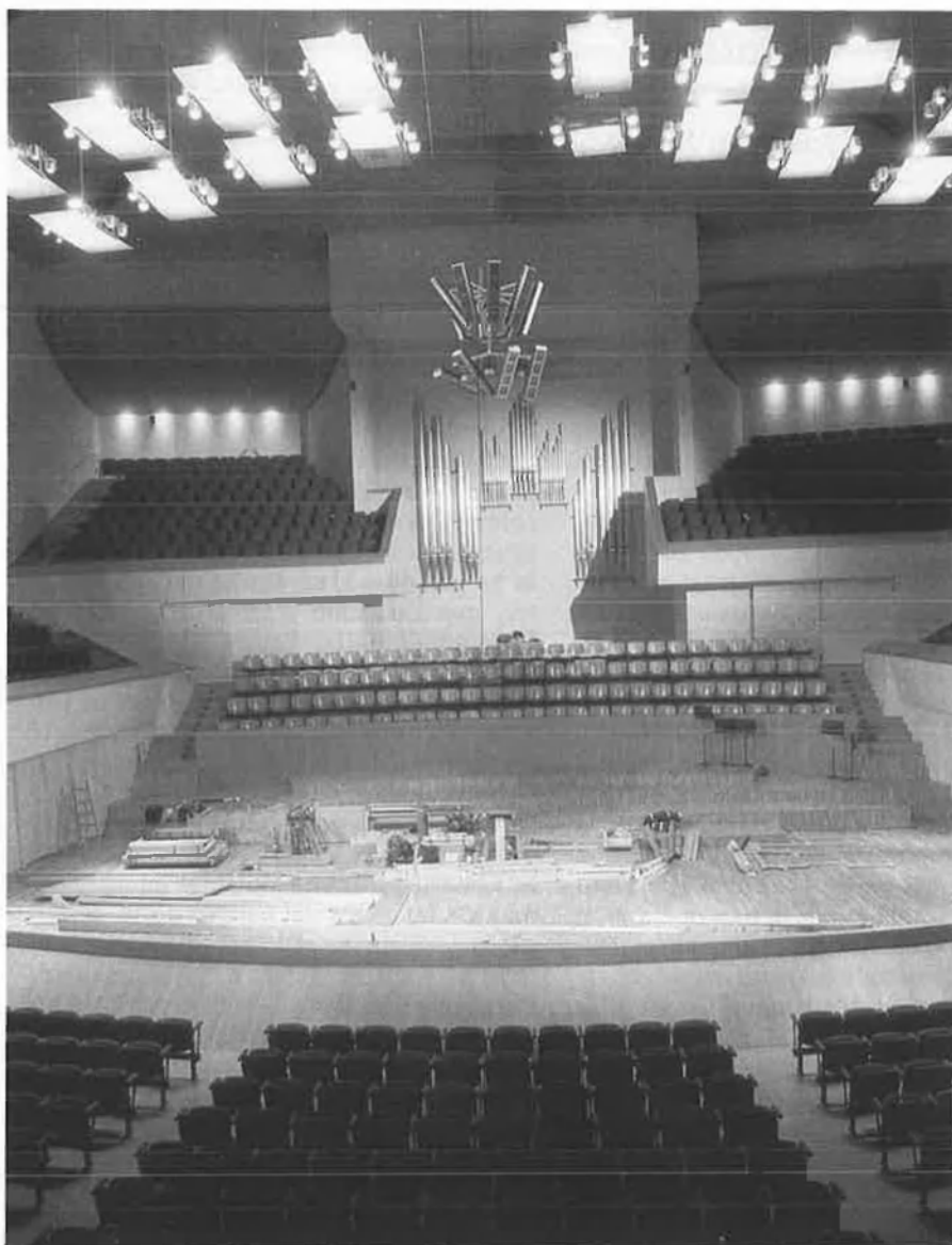
Palau de la Música de València.

neralitat valenciana, amb l'objectiu d'aconseguir un finançament estable.