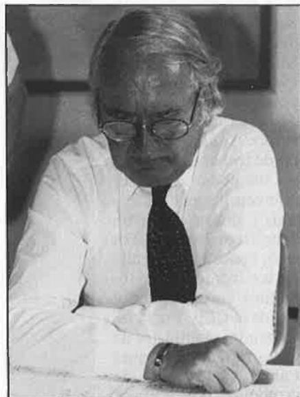
Richard Meier, arquitecte del Museu.