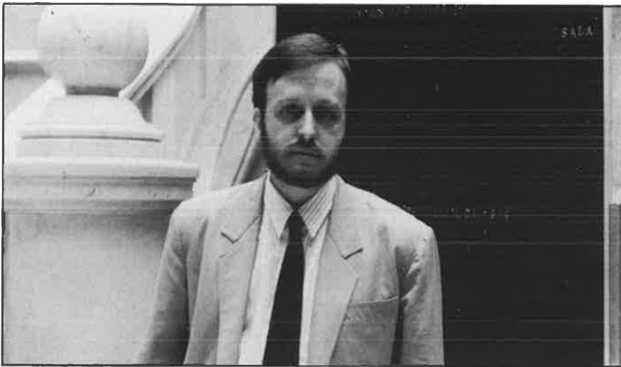
«Cal buscar una solució digna i no vexatòria per als presos polítics».

per de la lluita armada. En saber que alguns d'aquests presos mantenien aquestes tesis, em va semblar que podíem començar a treballar una proposta, proposta que vaig fer després ja directament a tots ells i que és la que ha sortit aquests dies als mitjans de comunicació: proposar al govern espanyol que s'assegui en una mateixa taula amb un portaveu dels presos independentistes (almenys dels històrics de Terra Lliure), que Terra Lliure oficialment digui i els presos afirmen que s'acorda una treva unilateral i indefinida i, a canvi d'això, el govern espanyol solventi cada cas i els excarceri en un curt període de temps.