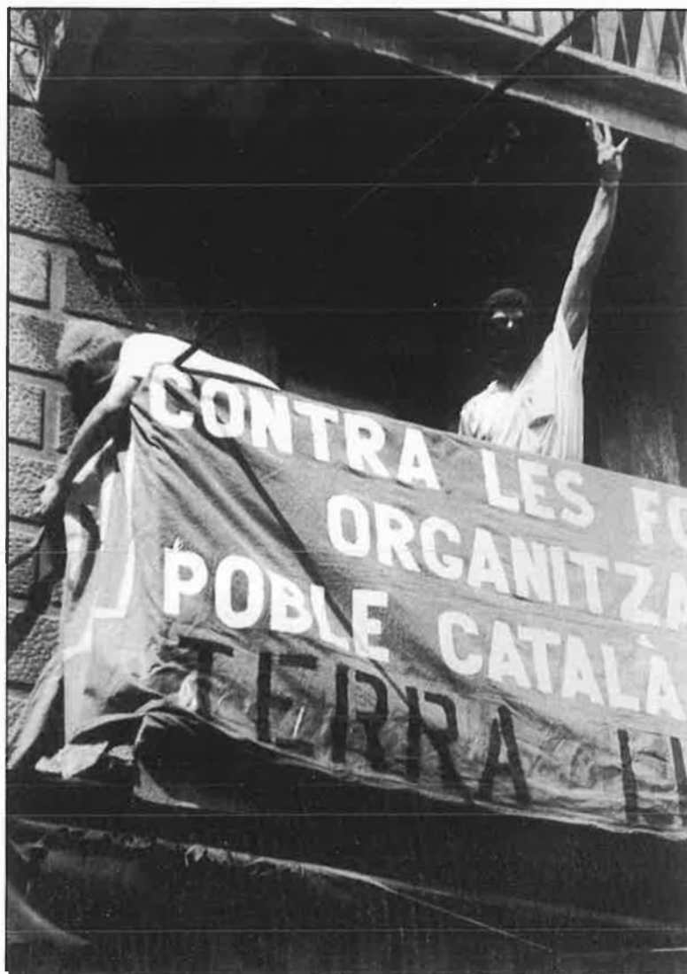
La negociació Terra Lliure-Interior. És, ara per ara, una incògnita.

Inevitablement, la importància política de la possible negociació Interior-Terra Lliure va eclipsar la no menys important victòria política del Moviment d'Alliberament Català, d'Allibe-