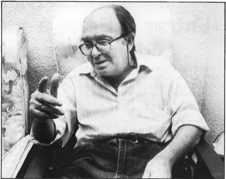
«Sóc tan marxista que no milite en cap partit».

—Ací tinc un llibre dedicat per Fraga. El mateix dia que van matar Puig Antich vaig estar sopant amb Fraga, a Londres. I des d'aquell moment que no vull saber res d'ell.