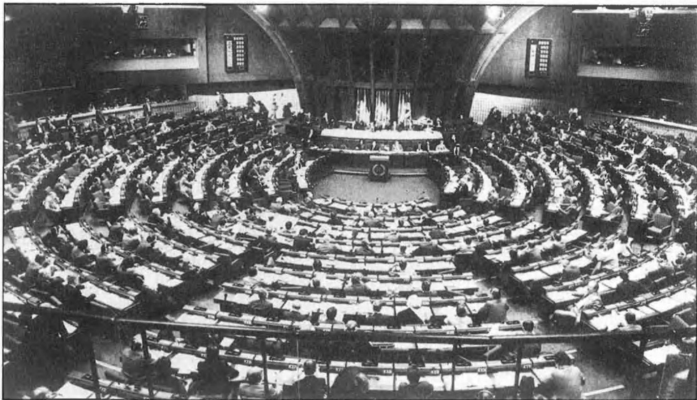
EL PARLAMENT D'ESTRASBURG, 'TUTTI FRUTI' DE PARTITS