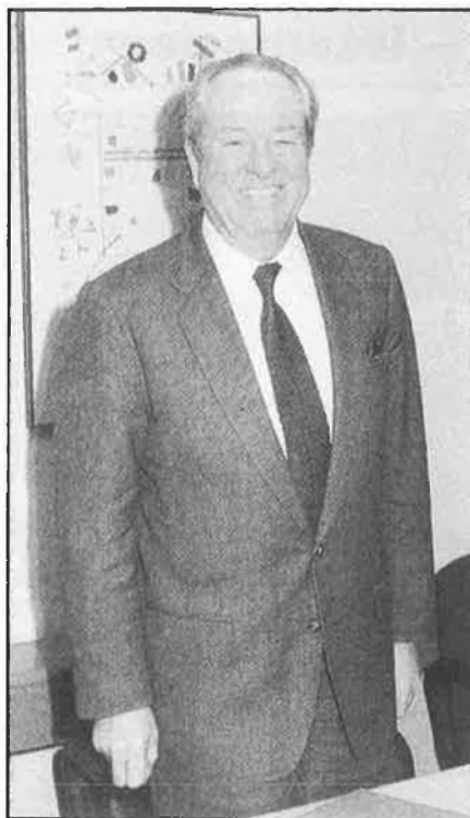
Jean-Marie Le Pen.

putats però continuen pràcticament amb els mateixos partits. Només cal destacar la coalició formada amb els Verds a Portugal, la Coalició Democràtica Unitària, que aconsegueix 4 diputats i la unitat dels dos partits comunistes grecs, que en trauen 3. El bloc més nombrós, com sempre, és l'italià, amb 22 diputats.