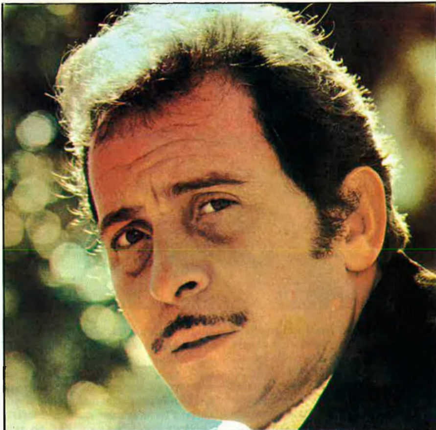
Domenico Modugno i Lluís Llach, dos plats forts dels concerts que aquest estiu se celebren a València i Palma de Mallorca.