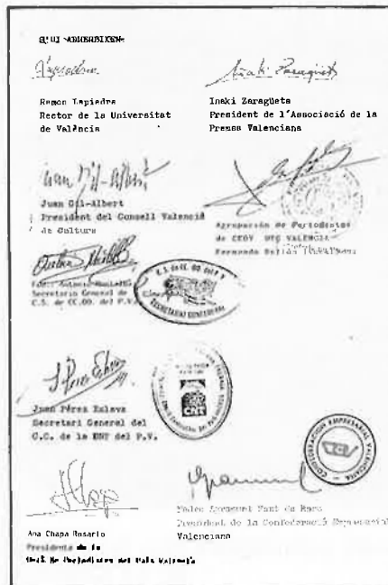
Fotocòpia del document de suport a les ajudes a la premsa en valencià.

Quan ja s'havia dit que enguany no hi hauria ajudes i després que el subsecretari del president Lerma, Ximo Puig, no va rebre les empreses afectades, se n'han vist de verdes i de seques.