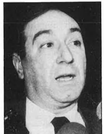
José María Bandrés.