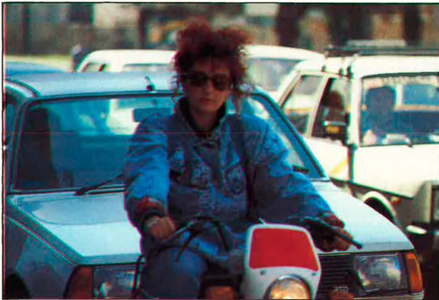
Amb la incorporació de la dona al treball han aparegut manifestacions de gelosia no sexual.

amb algú. La pèrdua de valor per l'abandonament fa trontollar la identitat pròpia en el malalt i desemboca en l'agressió.