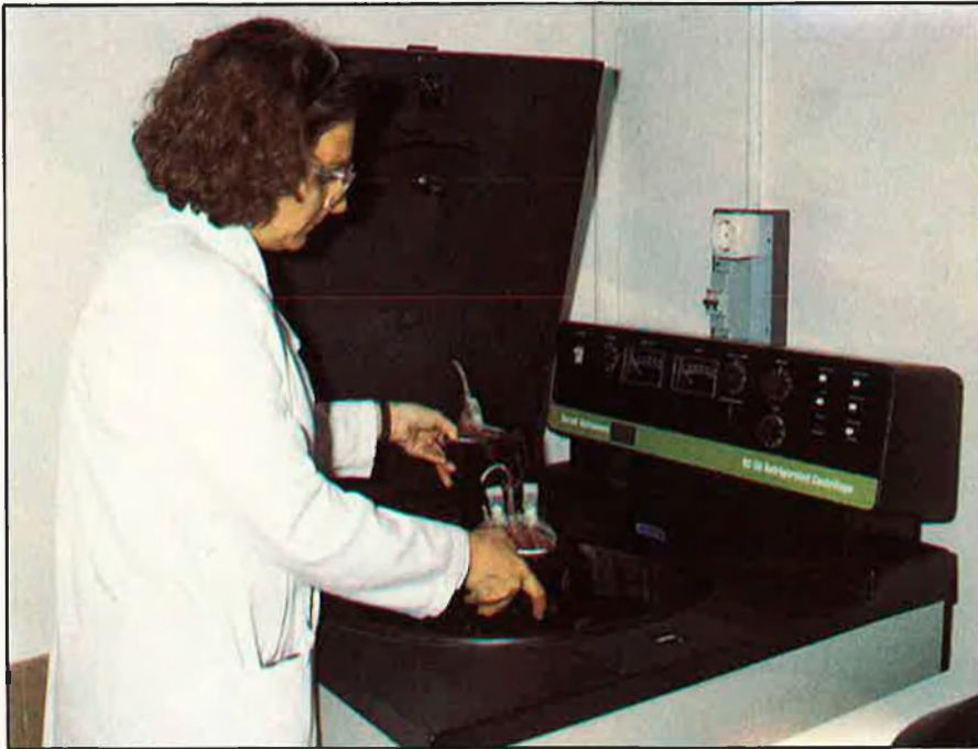
Culturalment, les banyes de l'home fan riure; les de les dones, fan llàstima.

que és un objecte de prestigi social per a l'home posseïdor. Les claus de la gelosia cultural són, per tant, la propietat, la rivalitat, el prestigi i el poder. També actuen sobre la dona que obté prestigi, benestar i poder de la relació amb un home. De l'altra, tenim la gelosia passional, que té a veure amb la concepció romàntica de l'amor, per la qual el sentiment d'autoestima és inseparable de la relació amorosa amb l'altra persona. Els psicòlegs i psiquiatres la relacionen amb la presència d'un sentiment d'inferioritat.