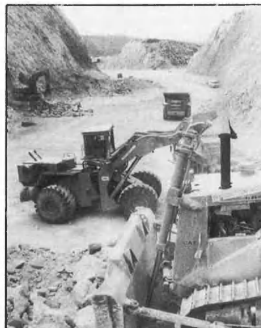
Les infraestructures viàries són objecte prioritari de