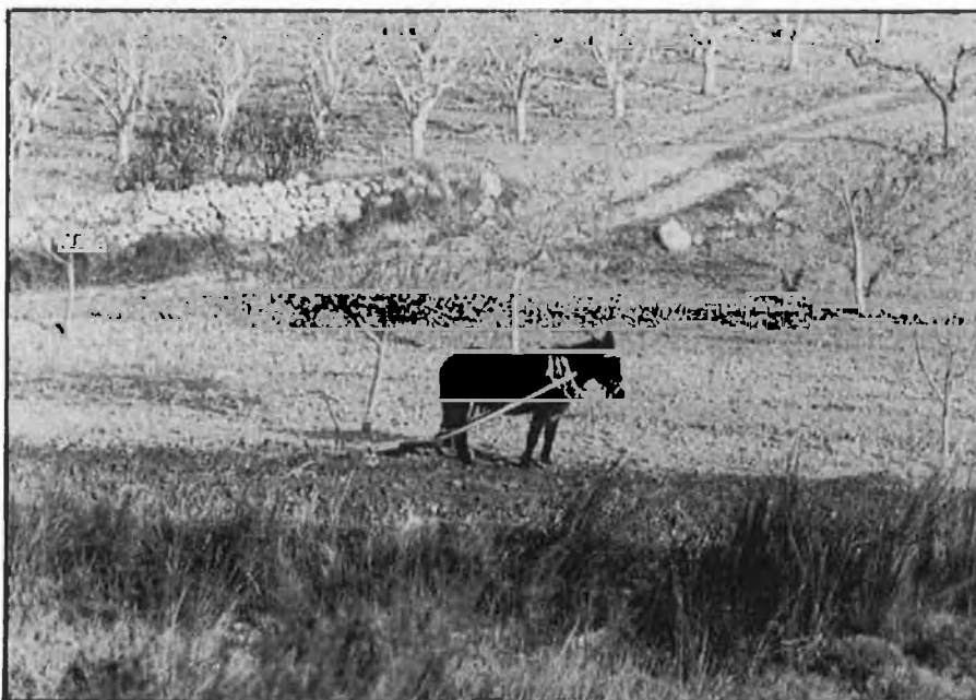
Les zones rurals més endarrerides seran objecte de plans plurianuals.

amb un PIB per càpita inferior al 75 per cent de la mitjana europea, on entra el País Valencià. 2) Reconversió de les regions amb declivi industrial —classificades com a regions de l'objectiu 2—, on s'inclou Catalunya. 3) Disminució de l'atur de llarga durada. 4) Mesures per a combatre l'atur juvenil. 5) Desenvolupament rural.