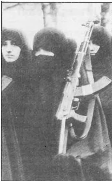
Un dels reptes de Rafsanyani serà el de fer concessions als més radicals.

països musulmans. Aquest grup ascendí per voluntat de Khomeyni, per frenar el poder dels moderats i accontentar un fill ambiciós que s'havia erigit en cap del seu gabinet. Ahmed Khomeyni controla el primer ministre, el ministre de l'Interior, Ali Akbar Moh-tachemi; el vice-president del Parla-ment, Mehdi Karrubi; el fiscal general, Mussavi Khoeniba, i el president dels Combatents Religiosos, Mohamed Jamarani. A més d'aquests cinc, enlairats en la cúpula del poder, el fill de Khomeyni disposa d'importantes simpaties entre el sector més tradicional de la jerarquia religiosa. La influència d'Ahmed Khomeyni quedà demostrada fa dos mesos, quan aconseguí que Ali Montazari fos destituït com a successor de l'imam Khomeyni, malgrat que havia estat nomenat tres anys abans pel consell d'experts. Montazari era l'exponent d'un sector més liberal encara que el de Rafsanyani, disposat a democratitzar les institucions, acabar amb la corrupció i limitar els poders d'Ahmed Khomeyni. Montazari ha perdut tota possibilitat de recuperar part del poder, però això no li impedeix continuar fustigant «un personatge irracional», en referència al fill de Khomeyni, i parlar de la necessitat d'incorporar els laics en el procés polític.