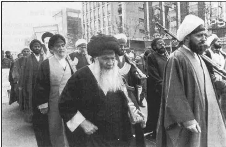
Iran necessita trencar l'aïllament i captar capitals per a reconstruir el país.

El projecte de Rafsanyani, desvelat en part en la seva primera conferència de premsa després de la mort de Khomeyni, depèn de la normalització de relacions amb els països àrabs, especialment les monarquies petroleres pròximes, la Unió Soviètica i Occident.