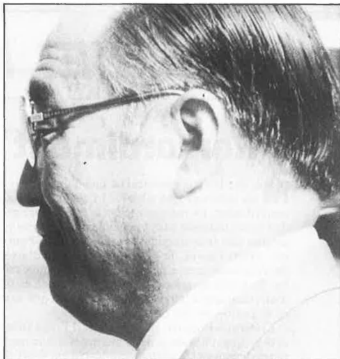
Bias Pinar i Sun Myung Moon, creador de la secta que l'ha fet famós.

CAUSA després, la secta es convertirà en part integrant i finançadora fonamental de la WACL, el club de l'extrema dreta internacional. En les seues reunions anuals, els homes de Moon entraran en contacte amb les sigles més inquietants de la ultradreta europea i mundial. També de l'espanyola, naturalment.