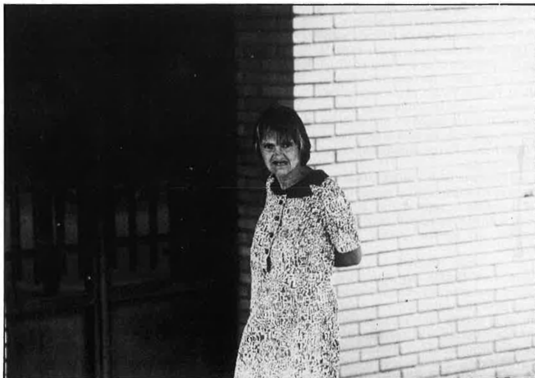
Els malalts, entre l'internament en centres psiquiàtrics o l'assistència extrahospitalària.

Davant l'actitud del diputat provincial de sanitat, els grups de funcionaris i especialistes partidaris de la deshospitalització es pregunten per què en compte de recórrer a les religioses no aprofiten els actuals Centres Comarcals d'Assistència Psiquiàtrica o es posen en pràctica altres alternatives que s'han proposat. «El trasllat d'aquestes persones —ha manifestat un portaveu del grup partidari de la deshospitalització, que prefereix mantenir-se en l'anonimat— és il·legal, perquè la ller estipula dues úniques maneres d'internament d'una persona en un centre psiquiàtric: una per autorització judicial, i l'altra per voluntat de la persona en qüestió. En el cas dels 46 malalts de Jesús no es dona cap de les dues circumstàncies. Això és greu perquè la Diputació està violant els drets d'aquestes persones, a més de donar marxa arreu a un projecte comunitari: la descen-