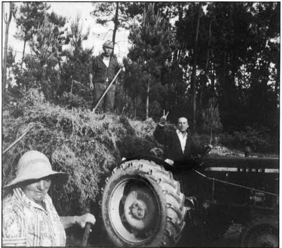
«Tindrè el vot dels homes i les dones creients».

— Vostè, membre supernumerari de l'Opus, és odiat per molts dels seus ger-