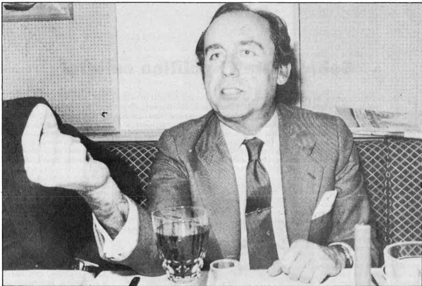
RUMASA ES REFÀ DES DEL PAÍS VALENCIÀ I CATALUNYA