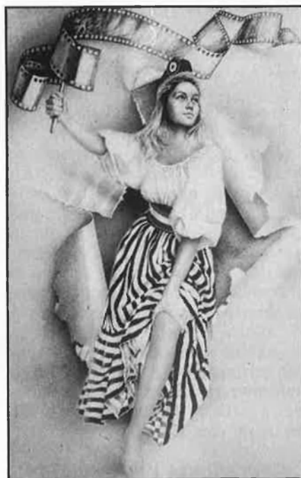
Cartell anunciador del festival.

En línies generals pot afirmar-se que totes les històries (des de les més dramàtiques fins a les més còmiques) estan contades amb un llenguatge convencional, com si els realitzadors tingueren por d'arriscar-se amb noves fórmules d'expressió, com si renunciaren a un tipus de provocació que, de vegades, resulta saludable. En fi, com si només la correcció fóra suficient per a obtenir el vist-i-plau de les audiències massives. El cine d'avui, pel que hem pogut apreciar a Canes, es refugia