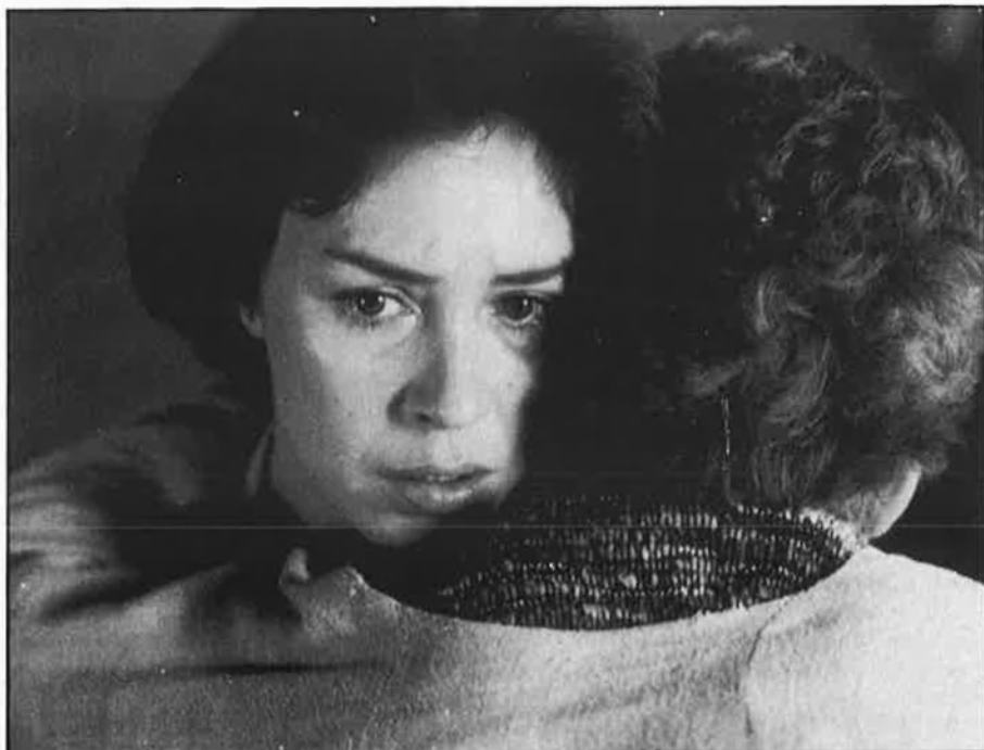
Fotograma de la pel·lícula 'El niño de la luna', d'Agustí Villaronga.