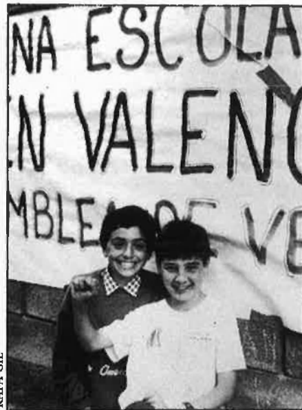
El govern valencià discrimina els alumnes que volen estudiar en la llengua pròpia.