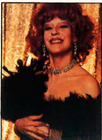
La Cubana. un per un, definitivament convertits en vedettes.

darrere de la festa de l'envelat. I de la curiositat de més grans, de descobrir també què hi ha darrere el paper de vedette.