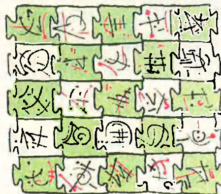
Disseny per ordinador realitzat per Mila Payà.

positiu, malgrat que no pot captar imatges tridimensionals.